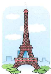
La tour Eiffel