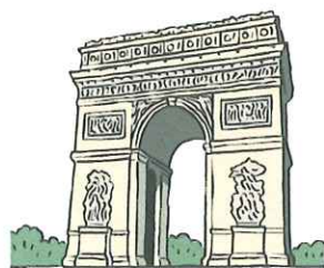
L'Arc de Triomphe